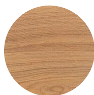
WHITE 5 PCT

Kleuren dienen slechts als voorbeeld. We raden aan om een test uit te voeren op identiek geschuurd hout.